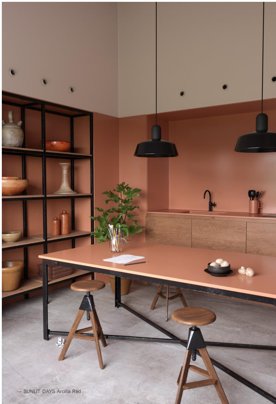
→ SUNLIT DAYS Arcilla Red